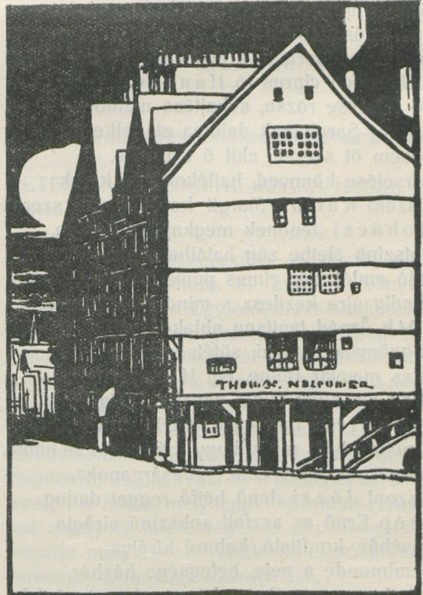
Schwalm Richárd rajza