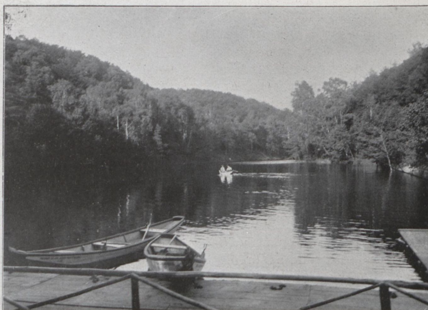
Vödric-völgy (II. tó)