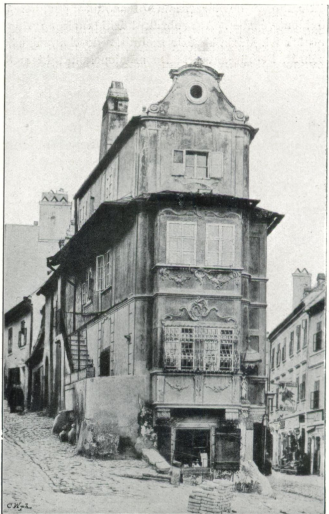
Ház „A jó pásztorhoz“ (XVII. század)

□ Ilyen monda van számtalan, majd humoros, majd borzalmas; sajnos eddigelé nem igen akadt, ki gyűjtögette volna őket.