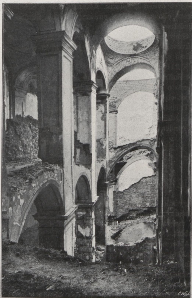
Lépcsőház a várban

ságával szemben fényárasztotta fenségében felemeli a halandó lelkét, szívét és melynek kincstára hazánkban nem igen leli párját. Méltóan sorakoznak hozzá a Ferenciek tornya és Szt. János kápolnája — utóbbi hazánk legtisztább gót műemléke — a Klarissák temploma (gót-unikum!), a vár Mátyás-kapuja és a városház kapubejárata és homlokzata. Van több renaissance-épületünk is, a még romjaiban is fenséges kir. vár rokkokó-stílt mutat, de mindezek eltűnnek, miként a kavicsok tömege, ha ragyogó gyémánt jön napfényre, midőn felcsillan a műrecek közt a gyémánt: a barokk, a pozsonyi stílus. E sorok írója ismerni vélte a város nevezetességeit, midőn azonban egy régi pozsonyi patricius-család ivadéka bejárta vele a belváros zezugos utcáit, hol a legkalandosabb formákkal, erkélyekkel, kiugrásokkal díszített házakra és házikókra figyelmessé lett, midőn kiderült, hogy a legszegényesebb környezetben álló Isten háza a szobrok és díszítések egész halmazát tartalmazza és hogy e művek mind egy oly művész lángeszét hirdetik, kit egy nép büszkeséggel a magaénak nevez, akkor bámulattal eltelve, kénytelen volt bevallani, hogy csak most kezdette Pozsonyt megismerni, ismerni azonban még mindig nem.