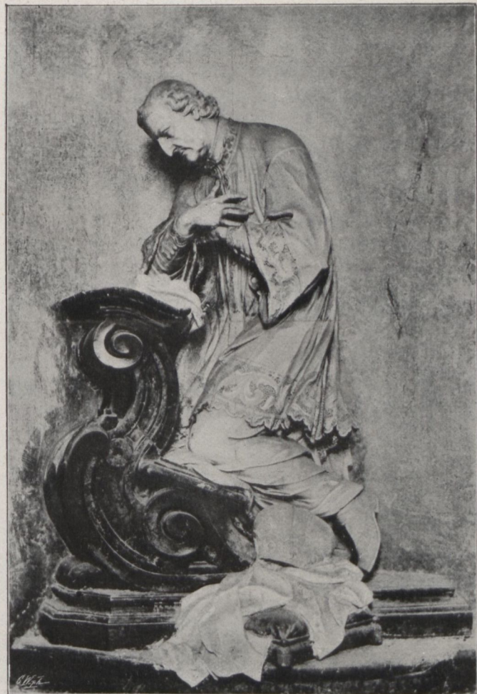
Donner Ráfáel: Eszterházy Imre hercegprimás szobra (1732)

□ Ne csak a nagy alkotásokat nézzük; aki azt keresi, csak a bámulatost fogja találni, de a bájosat, mi szemünket leginkább megörvendezteti, soha. Hisz van Pozsonynak nagy alkotása is bőven: A Primáspalota, melyhez annyi történelmi emlék fűződik, a Nyári-féle palota, a Mihály-torony és alatta a régi városkapu, a városárok a felvonóhiddal és a városfal egy részével, a Szt. Háromság-templom Galli Bibiena remek freskóival, Frigyes főherceg palotája, az Erzsébet-rend temploma, a koronázó székesegyház János-kápolnája a nagy Donner Ráfáel műveivel és a városház I. emeletén levő termek, melyek sorából csak a „Schranne“ gyönyörű stukkaturáját emelem ki. De a nagy alkotások mellett ott van a kis műrecek egész soro-