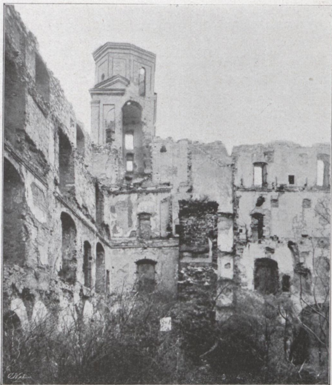
Lukács-torony a várban

□ De hogy ne fárasszam olvasóimat tovább, hát röviden végzem. A szobrok közül csak egy-kettőt sorolok fel, Mária Terézia szobrát, a dombon Pázmány szobrát, Petőfi szobrát. De mindenekelőtt kiemelem Donner Ráfánelnek, az osztrákok legnagyobb szobrászának remekműveit: Szt. Márton-szobra (a XVIII. század legjobb lovasszobra), Esterházy érsekprimás szobra, valamint még egynéhány kisebb műve. Pozsony gyűjteményei közül megemlítem a muzeumot,