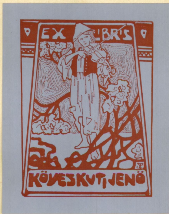
Szalay Pál rajza