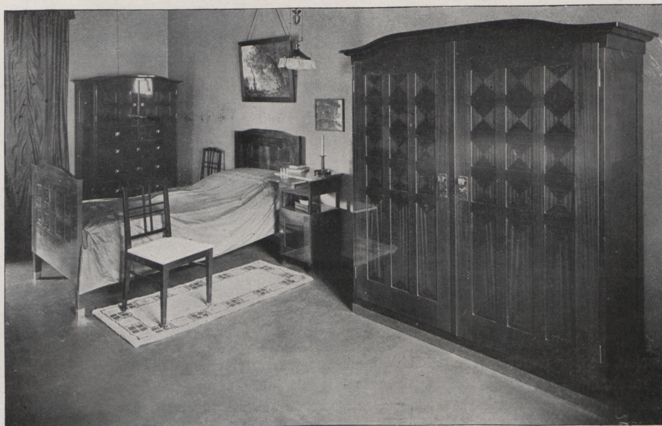
A „Deutsche Werkstätten für Handwerkskunst A.-G. Dresden-Hellerau“ készítményei után